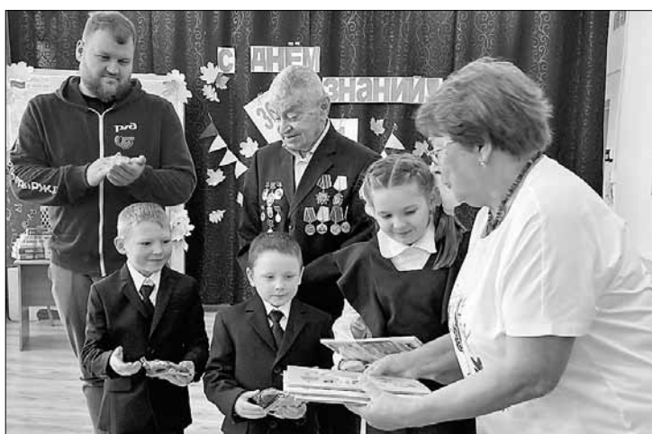
■ Главная задача совета ветеранов Исакогорского округа – организация досуга людей серебряного возраста