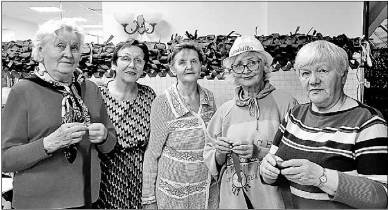
■ Маймаксанский совет ветеранов максимум сил и внимания отдает поддержке участников спецоперации