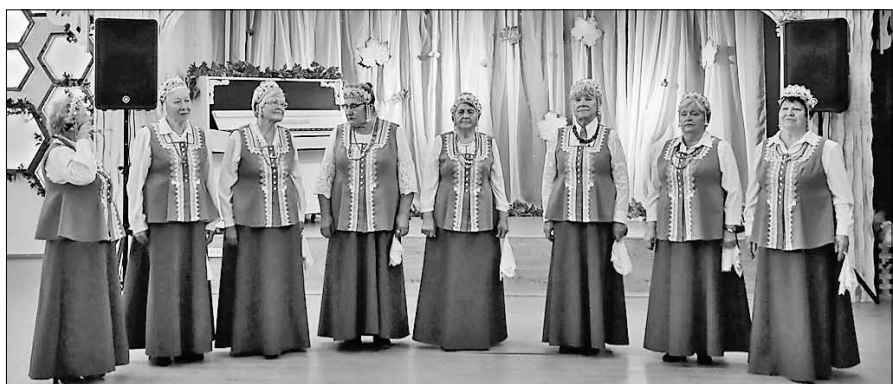
■ Ветераны Соломбалы и лично председатель организации часто бывают в образовательных учреждениях, проводят уроки мужества